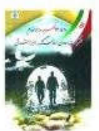
تمبر یادبود ۹۹ شهید شرکت